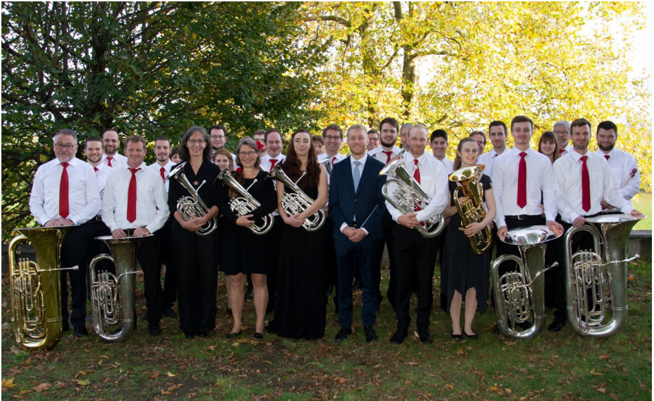
Die Brass Band Gürbetal im Herbst 2022.