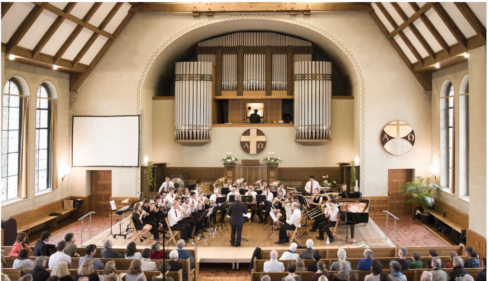
Die Brass Band Gürbetal in Spiez im Jahr 2019 beim Gemeinschaftskonzert mit Orgel.

Die Unterstützung kann auch in Form von Leistungen erfolgen.